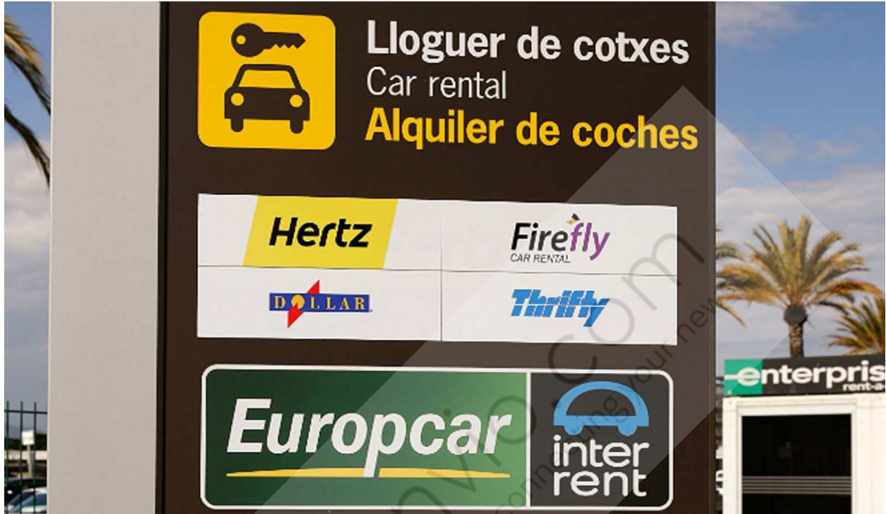
Europcar en el Aeropuerto de Barcelona.

El Grupo Europcar ha anunciado este lunes la firma de un acuerdo con Investindustrial para adquirir la compañía de alquiler de coches de bajo coste Goldcar . Con esta compra "estratégica", de la que no se ha facilitado la cantidad, Europcar aumentará su exposición en tres "grandes" motores de crecimiento: la región mediterránea, el segmento del ocio y el de bajo coste a nivel europeo.