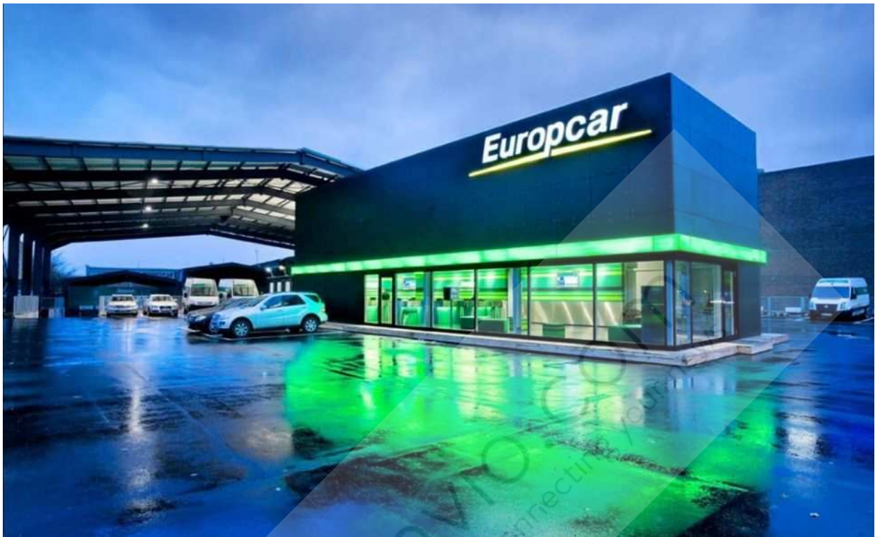
Oficina de alquiler del grupo francés Europcar, en una imagen facilitada por la compañía.

El grupo francés de alquiler de vehículos Europcar crece en la Península Ibérica. Adquiere una de las firmas principales en el segmento low cost, la española Goldcar , con fuerte presencia en España y Portugal. El importe de la transacción no ha sido revelado, aunque Europcar informa a través de una nota que valora el conjunto de la compañía en 550 millones de euros. La compra se hará efectiva en la segunda mitad de este año.