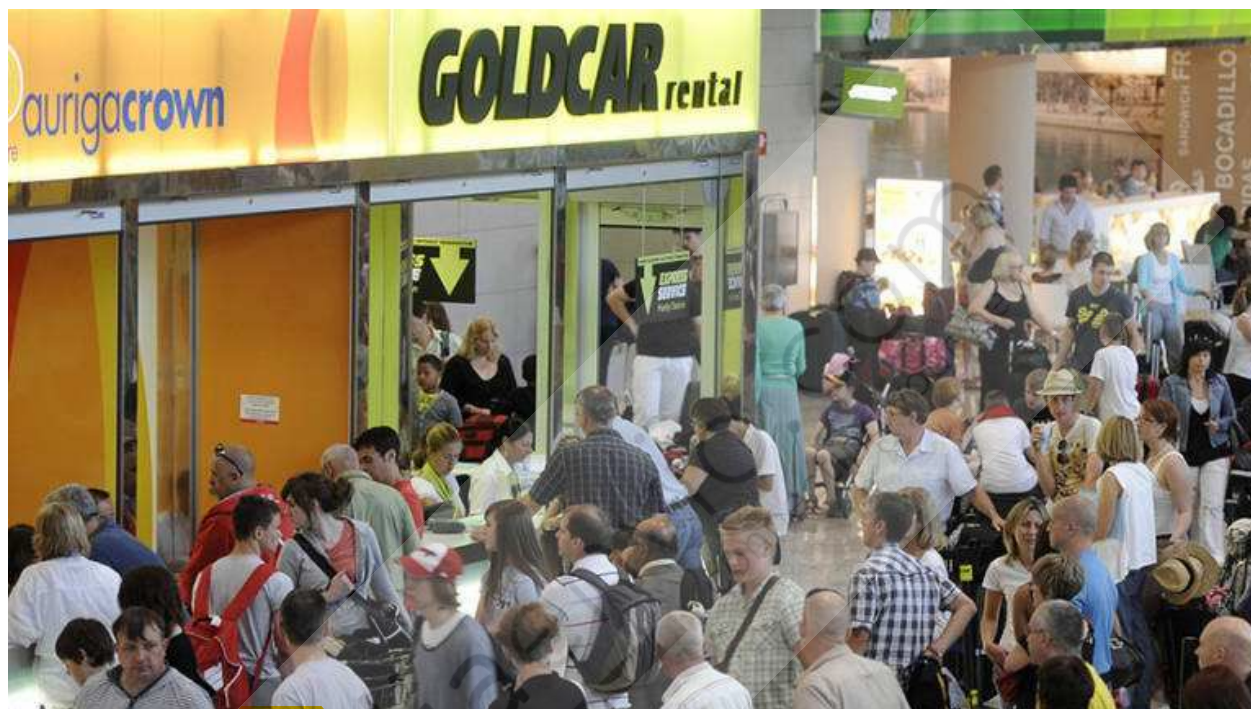
Oficina de alquiler de Goldcar en el aeropuerto de Alicante-Elche.