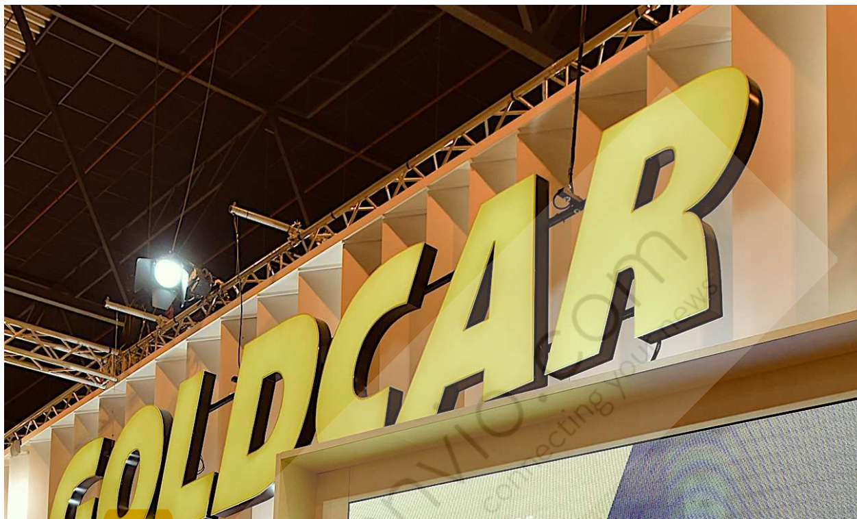
El logotipo de Goldcar, en un stand de la compañía en una feria de muestras, en Madrid.