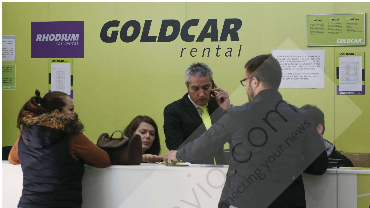
Mostrador de Goldcar en Barajas. kike para

La empresa francesa de alquiler de coches Europcar ha acordado comprar el competidor español Goldcar , a la que presenta como “la mayor compañía europea low cost ” del sector, por 550 millones de euros, según informa la empresa en un comunicado . Es la cuarta adquisición de Europcar este año, lo que ha colocado sus acciones en máximos históricos. La intención de Europcar es crecer en el segmento low cost del alquiler de vehículos, en el que ya ha realizado otras operaciones.