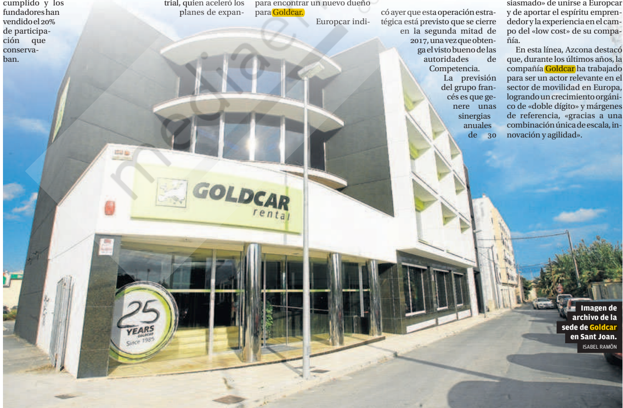
Imagen de archivo de la sede de Goldcar en Sant Joan.

La previsión del grupo francés es que genere unas sinergias anuales de 30