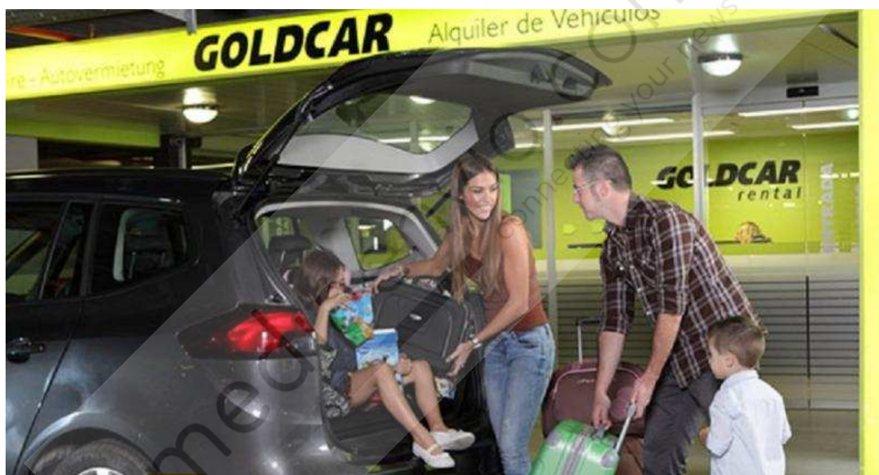
Europcar adquiere Goldcar y entra en el segmento low cost

Goldcar es un importante operador de bajo coste en Europa gracias a su fuerte posicionamiento en España y Portugal, y su sólido know-how en la gestión eficiente de un modelo operativo low cost puro. Goldcar ha tenido un fuerte crecimiento orgánico (logrando un aumento de 17% de ingresos entre 2008 y 2016) y los mejores márgenes de EBITDA corporativo y las tasas de conversión FCF. En 2016, Goldcar generó unos ingresos de alrededor de 240 millones de euros y un EBITDA corporativo estimado de aproximadamente 48 millones de euros.