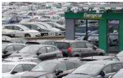
1 de 1 Tamaño Completo

(Reuters) - Europcar ha acordado comprar la mayor empresa de alquiler de coches a bajo coste en Europa, Goldcar, dijo el lunes la empresa francesa, alcanzando su cuarta adquisición este año y enviando sus acciones a un máximo récord.