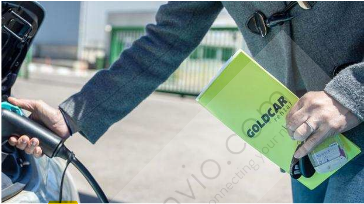
Un cliente de Goldcar repostando

El Grupo Europcar ha anunciado hoy la firma de un acuerdo con Investindustrial para adquirir la compañía de alquiler de coches de bajo coste Goldcar .