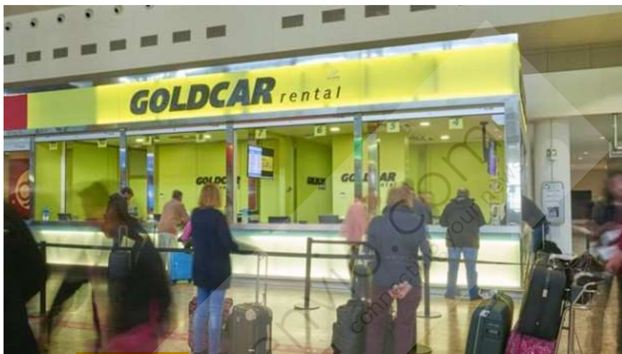
Recurso de Goldcar GOLDCAR

La empresa francesa de alquiler de vehículos Europcar ha alcanzado un acuerdo con Investindustrial para la adquisición de la firma española Goldcar, valorada en 550 millones de euros, con el fin de aumentar su presencia en la zona mediterránea, así como de reforzar su presencia en el segmento de ocio y de bajo coste, según informó la empresa en un comunicado.