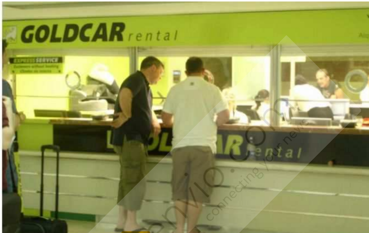
Ventanillas de la empresa de alquiler Goldcar , en Alicante

La compañía francesa de vehículos en alquiler Europcar ha anunciado la compra de su competidora Goldcar por un importe no desvelado.