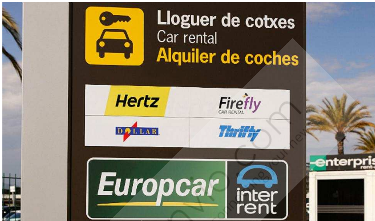
Europcar en el Aeropuerto de Barcelona.

El Grupo Europcar ha anunciado este lunes la firma de un acuerdo con Investindustrial para adquirir la compañía de alquiler de coches de bajo coste Goldcar. Con esta compra "estratégica", de la que no se ha facilitado la cantidad, Europcar aumentará su exposición en tres "grandes" motores de crecimiento: la región mediterránea, el segmento del ocio y el de bajo coste a nivel europeo.