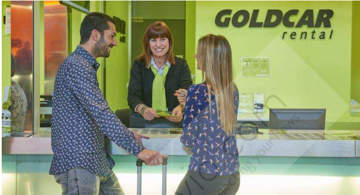
Mostrador de Goldcar.

La empresa francesa de alquiler de vehículos Europcar ha alcanzado un acuerdo con Investindustrial para la adquisición de la firma española Goldcar, valorada en 550 millones de euros, con el fin de aumentar su presencia en la zona mediterránea, así como de reforzar su presencia en el segmento de ocio y de bajo coste, según informó la empresa en un comunicado.