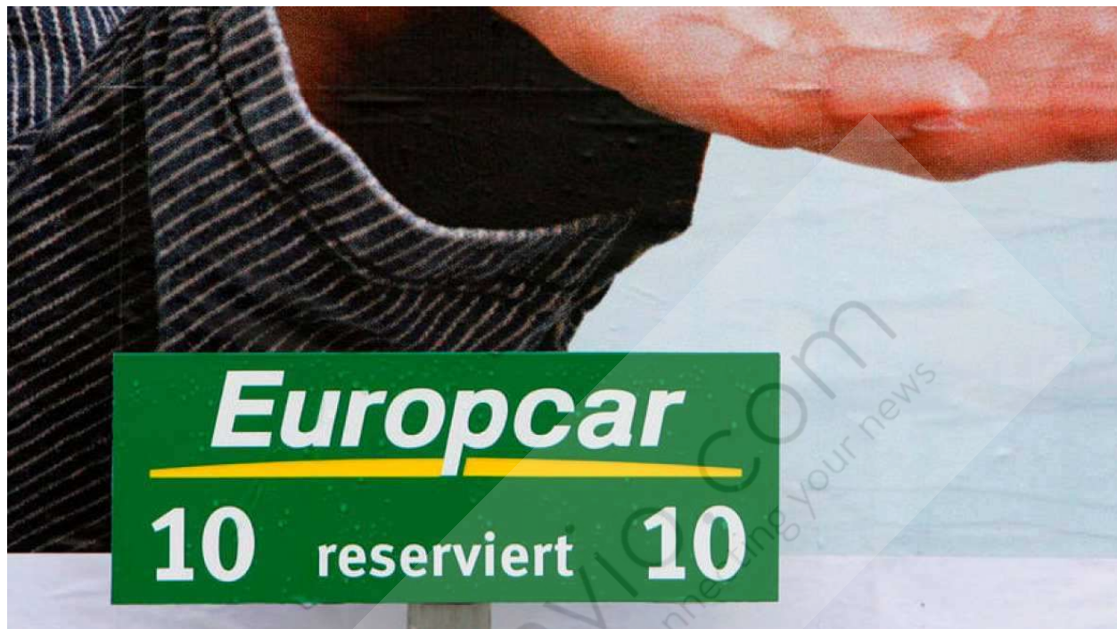
Imagen de archivo de un cartel publicitario de la compañía Europcar