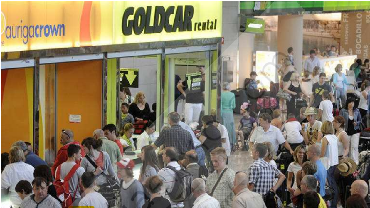
Oficina de alquiler de Goldcar en el aeropuerto de Alicante-Elche.