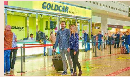
La mayoría de las 87 oficinas de Goldcar están en aeropuertos.

La adquisición se suma a la de la alemana Buchbinder, que permite a Europcar ser el mayor operador del segmento de bajo coste