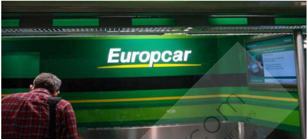
Oficina de Europcar en el aeropuerto de Frankfurt, Alemania. (M. LEWISON)

La empresa francesa de alquiler de vehículos Europcar ha alcanzado un acuerdo con Investindustrial para la adquisición de la firma española Goldcar , valorada en 550 millones de euros, con el fin de aumentar su presencia en la zona mediterránea, así como de reforzar su presencia en el segmento de ocio y de bajo coste, según informó la empresa en un comunicado.