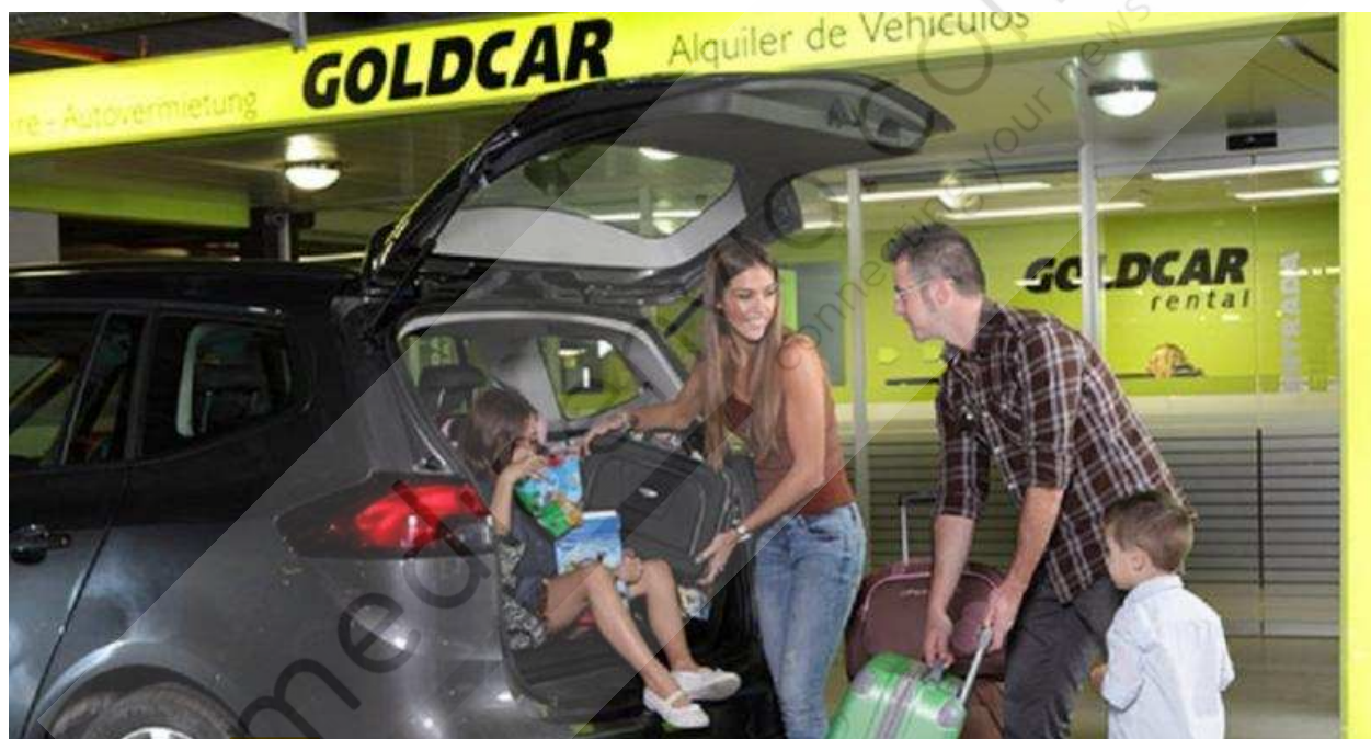
Europcar adquiere Goldcar y entra en el segmento low cost

Goldcar es un importante operador de bajo coste en Europa gracias a su fuerte posicionamiento en España y Portugal, y su sólido know-how en la gestión eficiente de un modelo operativo low cost puro. Goldcar ha tenido un fuerte crecimiento orgánico (logrando un aumento de 17% de ingresos entre 2008 y 2016) y los mejores márgenes de EBITDA corporativo y las tasas de conversión FCF. En 2016, Goldcar generó unos ingresos de alrededor de 240 millones de euros y un EBITDA corporativo estimado de aproximadamente 48 millones de euros.