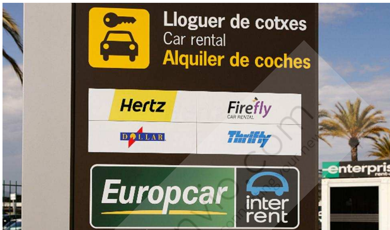
Europcar en el Aeropuerto de Barcelona.

El Grupo Europcar ha anunciado este lunes la firma de un acuerdo con Investindustrial para adquirir la compañía de alquiler de coches de bajo coste Goldcar. Con esta compra "estratégica", de la que no se ha facilitado la cantidad, Europcar aumentará su exposición en tres "grandes" motores de crecimiento: la región mediterránea, el segmento del ocio y el de bajo coste a nivel europeo.