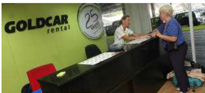
Un empleada de Goldcar atiende a una usuaria.

La empresa francesa de alquiler de vehículos Europcar ha alcanzado un acuerdo con Investindustrial para la adquisición de la firma alicantina Goldcar , valorada en 550 millones de euros , con el fin de aumentar su presencia en la zona mediterránea , así como de reforzar su implantación en el segmento de ocio y de bajo coste , según informó la empresa en un comunicado.