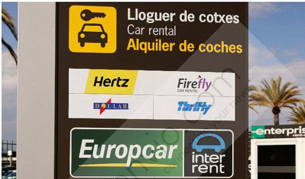
Europcar en el Aeropuerto de Barcelona.

La adquisición permitirá a la firma afianzar su posición europea en precios bajos